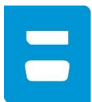
Cổng kết nối: DisplayPort, VGA